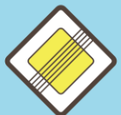
Конец главной дороги